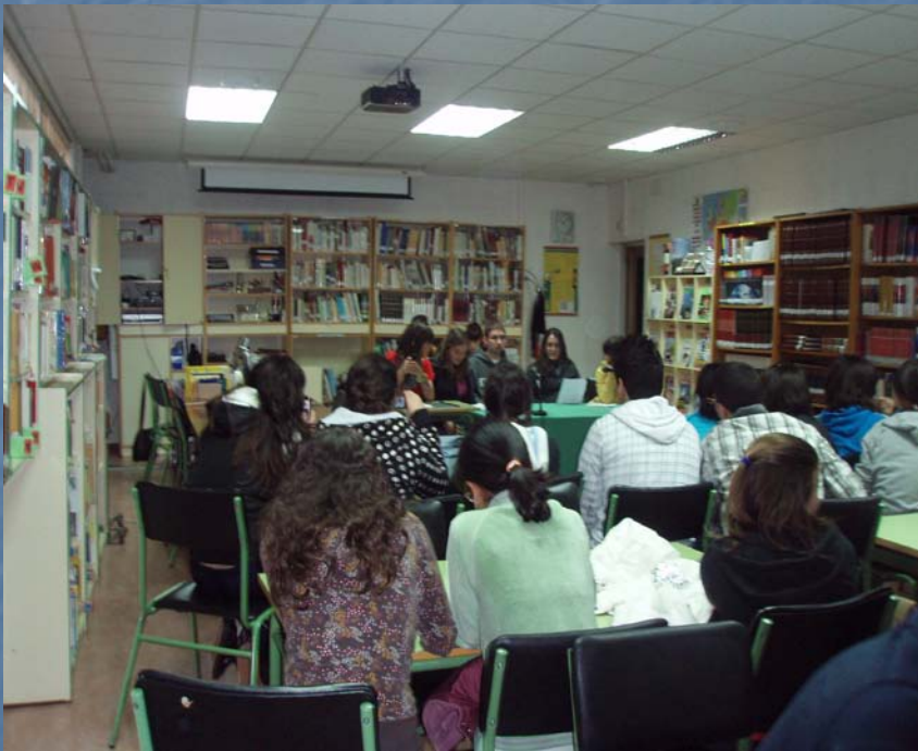
Recitación y audición musical Mayo, 2009