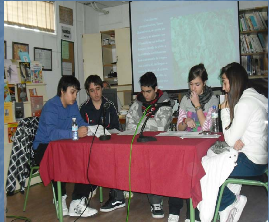
“El mito de Procne y Filomela”