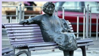
4. Estatua de Rosa Chacel