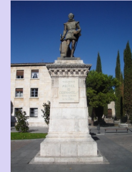
6. Estatua de Cervantes