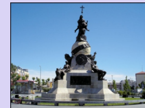
8. Monumento a Colón