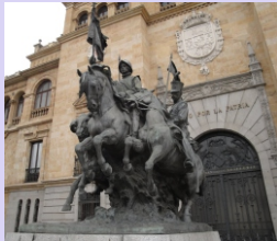
2. Monumento a los Héroes de Alcántara