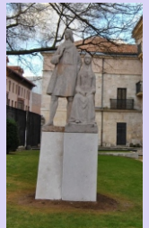
7. Estatua de los Reyes Católicos