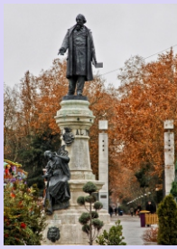
1. Monumento a José Zorrilla