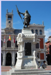
3. Estatua del Conde Ansúrez